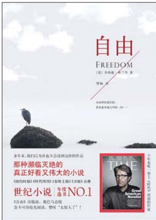
书名:《自由》 作者:[美]乔纳森·弗兰岑 译者:缪梅 出版社:南海出版公司 出版日期:2012-05

正所谓群众的眼睛是雪亮的,现代奥运会或多或少地受到了商业利益的影响,这在短时期内是无法彻底消除的,很多人也看到了局部的阴暗面,但本书作者依旧从宏观上对今天的奥运精神持有乐观和赞扬的态度。在笔者看来,这本虚构的小说也是对当今与奥运会有关的各行各业人士提个醒,千万不要因小失大,为了点蝇头小利而给伟大的奥林匹克精神带来污点。