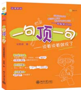
书名:《一句顶一句》 作者:宋春涛 出版社:北京大学出版社 出版日期:2012-06

方科长是潮汕人,南方某知名高校的法律系研究生,工作上有思路,有方法,深受领导器重,年纪轻轻就被提拔为科长。但他在对待同事时,态度上多少有点轻慢之意。