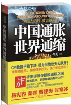
书名:《中国通胀,世界通缩》 作者:牛刀 出版社:中国商业出版社 出版日期:2012-05

一个简单的定义,一般认为他们是在一线城市年薪20万—50万元、二三线城市年薪10万—30万元的高级白领阶层,他们的收入和消费相比略有盈余,可是盈余的钱怎么办?中产阶层手里拿着一点尴尬的资金,不知怎么办。