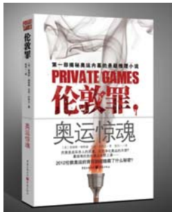
书名:《伦敦罪:奥运惊魂》 作者:[美]詹姆斯·帕特森 马克·沙利文 译者:张兵一 出版社:重庆出版社 出版日期:2012-05

虽然这是一本虚构的悬疑小说,但由于这本书的上市时间正好临近伦敦奥运会开幕,并且讲述的也全都是奥运会前后的过程,因此读者免不了会将其与真实世界做对比,寻找共同之处。 令人欣慰的是,尽管故事的开头对奥林匹克精