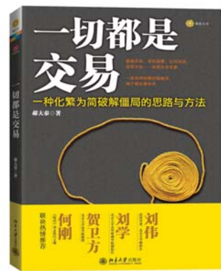
书名:《一切都是交易》 作者:郝大秦 出版社:北京大学出版社 出版日期:2012-06

国女性在职场、生活中的真实场景,堪称“纸上美剧”。每个人的幸福都无法复制,而到底价值5克拉的爱情,会在什么地方出现,看完这本书,或许每个人心里都会有自己的答案。