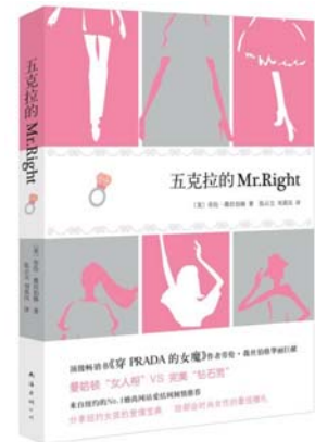
书名:《五克拉的Mr.Right》 作者:[美]劳伦·薇丝伯格 出版社:南海出版公司 出版日期:2012-05

经被摧毁或者重新建构的美国,那里的人们只能手足无措地寻觅,甚至无法意识到他们究竟丢失了些什么。书中所呈现的其实更多的是人物心理描写,令读者感同身受,都能从中找到自己的影子。