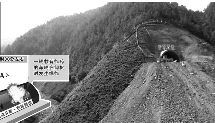
▲正在建设的炎汝高速。 资料图 ◀湖南炎汝高速一在建隧道爆炸事故示意图 新华社发