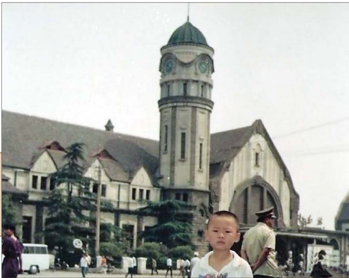
◀一名孩子在老火车站的钟楼前拍照留念。