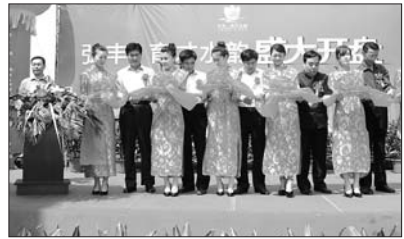
相关嘉宾及公司负责人为开盘剪彩。

育才水韵小区位于却坡河畔,紧邻五莲一中,配套设施完善。其中,日常使用的卫生间厨房用热水完全由高层建筑太阳能一体化系统供给,绿色、环保、节能,在五莲县高层住宅建筑中绝无仅有。