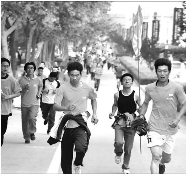
19日早晨,两千余名市民参加晨跑活动。

本报5月20日讯(见习记者 吴江) 5月19日早晨,日照市首届全民晨跑活动隆重举行。来自日照市各个行业的两千余名晨跑者在市区行程3.2公里,共同用晨跑叫醒身体,用活力叫醒日照。