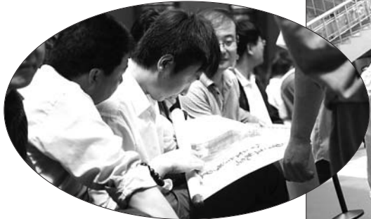
▲前来鉴宝的市民正在交流。

5月18日是国际博物馆日,日照市博物馆请来了3名省内知名文物鉴定专家为市民现场鉴宝,百余名市民带着五百余件各类藏品前来鉴定。然而五百余件藏品之中,仅一成为真品,专家呼吁应出于爱好理性收藏,不能只向钱看齐。