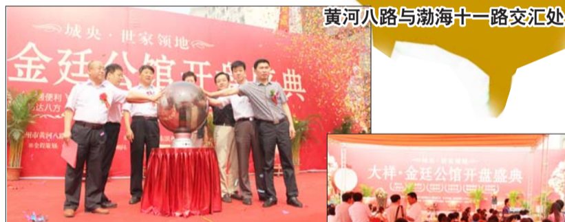
黄河八路与渤海十一路交汇处