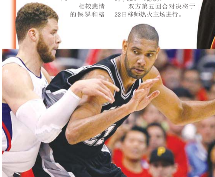
“石佛”邓肯重现青春。