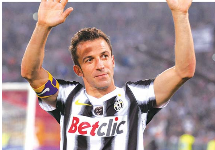
斑马王子皮耶罗带着一丝遗憾告别。

而那不勒斯已经回忆不清那站在领奖台顶的滋味,他们最近一次获得意甲冠军还是在1990年,当时这支球队的灵魂人物,还是伟大的马拉多纳。而上一次捧得意大利杯则要再往前推3年(1987年)。