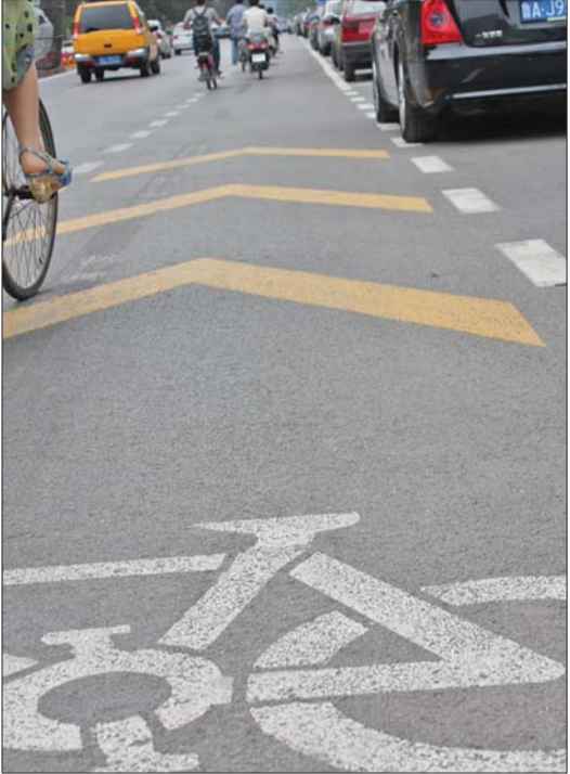
自行车行进在专用车道上。

与此同时,为了保障行人搭乘出租车方便,纬一路上还将开辟6个出租车停靠点,方便市民乘车,也避免出租车停靠无序加剧交通拥堵。