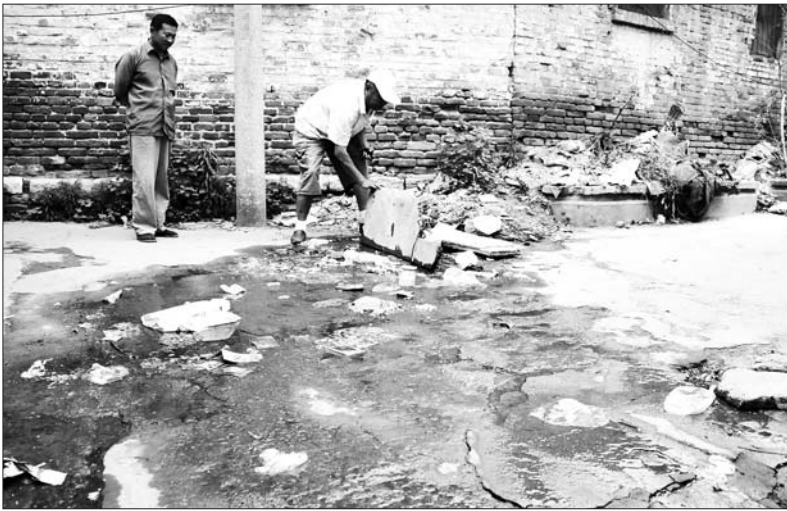
附近居民用废旧建材将漏水处掩盖起来。

本报2110110消息(记者 孔令茹) 市中区新华街一处水表井由于井盖被偷,居民自己建了一个“井盖”,导致井内的水表伸缩器破损漏水,济宁中山公用水务有限公司管网工程部维修人员赶至现场后,更新了损坏零部件,并按标准尺寸恢复水表井外观。