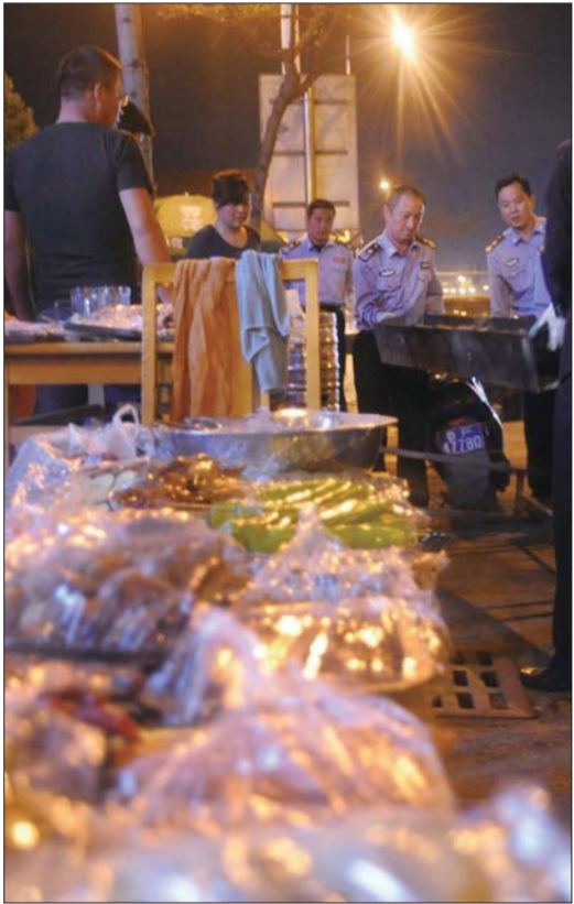
城管人员将烧烤摊的烧烤炉收走

夏天到了,占道烧烤火起来了,市民的投诉也多了。5月11日,记者跟随芝罘区城市管理行政执法大队机动中队的队员们,参与他们整治占道烧烤摊的工作。在整治现场,记者见证了烧烤摊主和城管队员们“打游击”的过程。