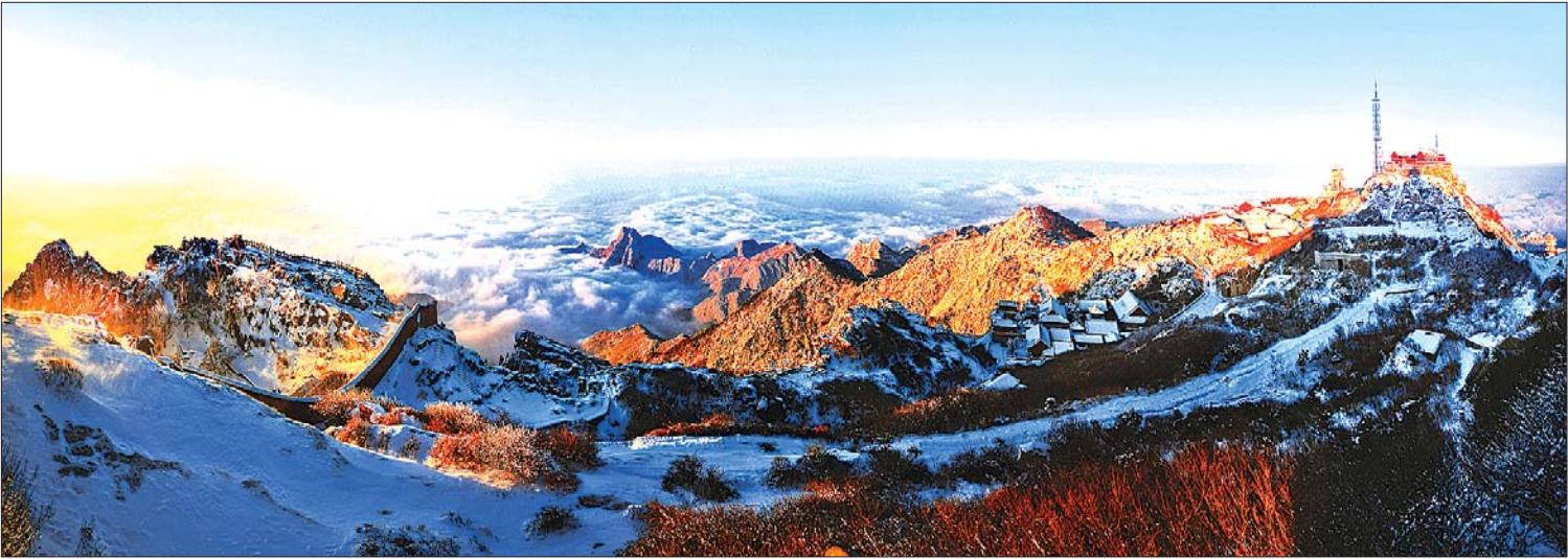
冬赛金奖《泰山稳四海安》