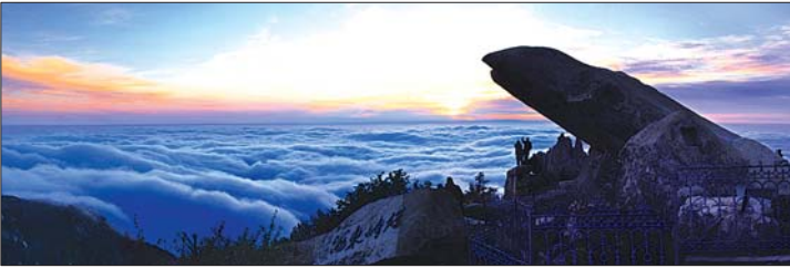
秋季赛银奖《气吞山河组照》之一