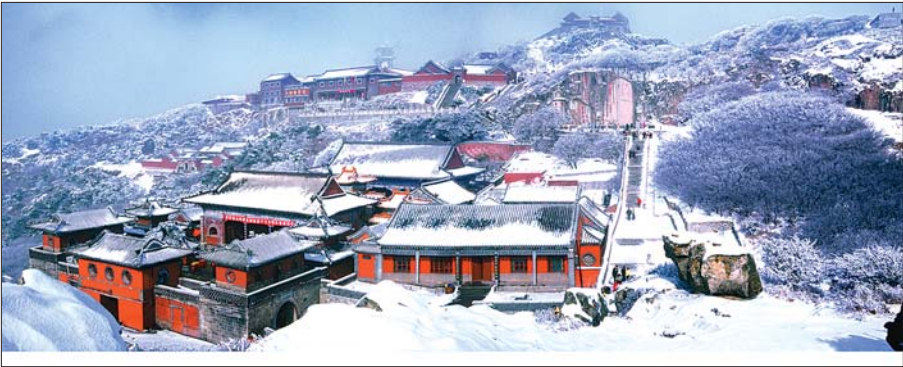
冬赛银奖《冬日碧霞祠》