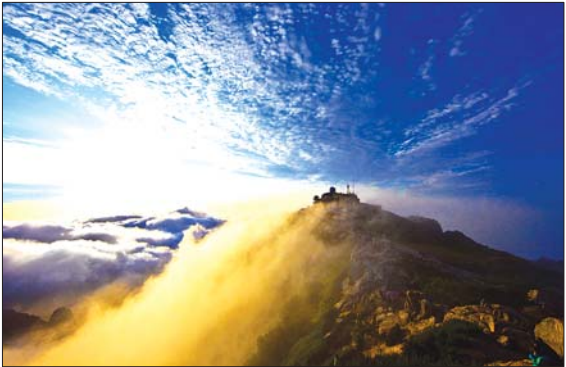
秋季银奖《云起泰山》