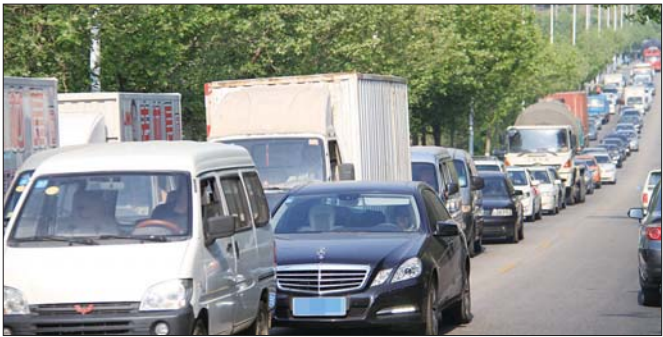
百余辆汽车因事故受阻。

在下坡路段时, 因车身沉重, 一时刹不住车, 搅拌车司机躲避不及, 撞在前面的小货车上。 小货车是一辆运送氧气钢瓶的车辆。被撞后, 小货车冲出一个车位的距离, 车上的氧气钢瓶也被撞落。当时钢瓶内充有氧气, 还好没有发生更大的意外。 过往车辆因事故造成拥堵, 从红绿灯位置一直拥堵到陶家夤隧道附近。后经交警及时疏导, 该地交通恢复畅通。