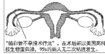
“输卵管不孕膜术疗法”, 在术后施以美国高科技生物蛋白膜, 95%的病人无二次粘连发生。

济南天伦不孕不育医院独创的“输卵管不孕膜术疗法”给饱受输卵管不孕折磨的病人带来新的“生机”, 也标志着不孕症领域“三联联合”腹腔镜手术新时代的到来, 这是一个令国内医学界瞩目的成果!