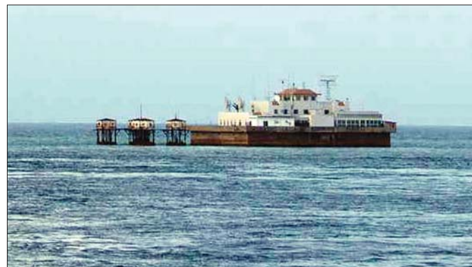
如今我守礁官兵住在钢筋混凝土筑成的第三代高脚屋内。