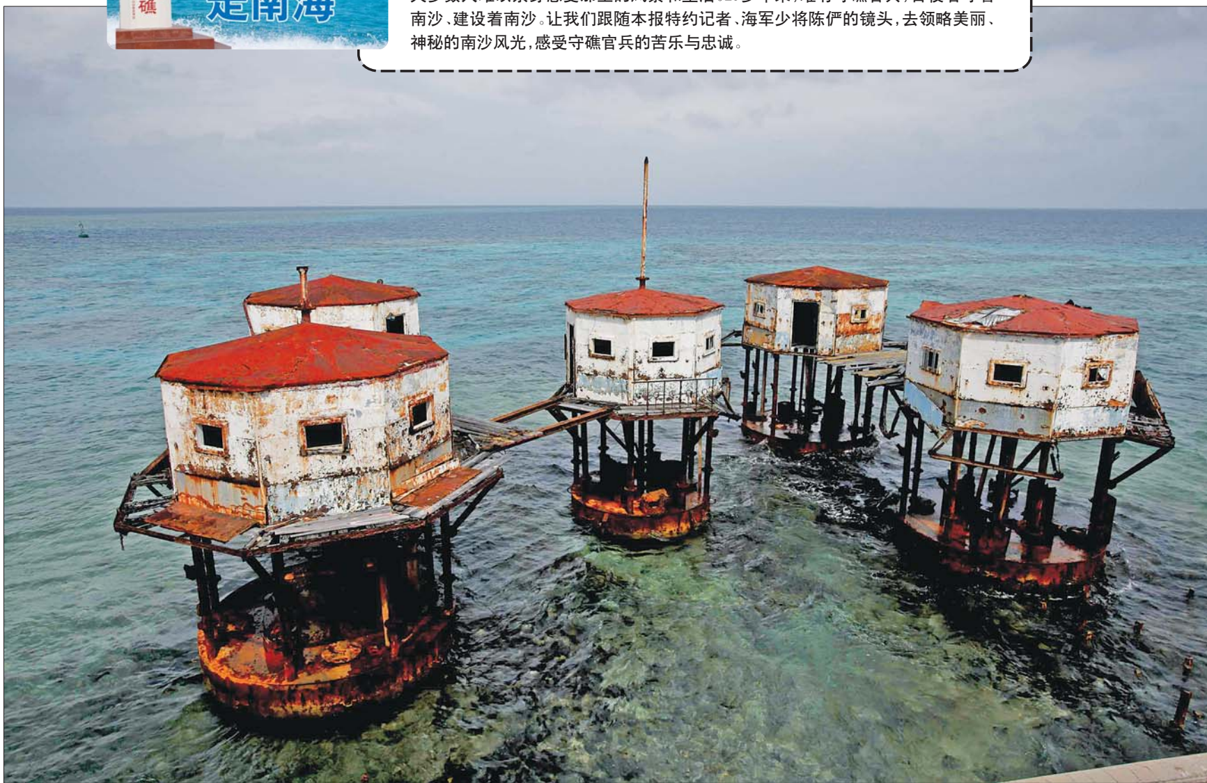
几座守礁官兵曾经住过的第二代高脚屋。早期,我南沙守礁官兵就住在这样的高脚屋内,由于铁皮当墙,酷暑季节屋内常如火炉一般。

南沙群岛如一粒粒珍珠,装点着我国的南疆。然而它们远离陆地1000多公里,大多数人难以亲身感受那里的风景和生活。20多年来,唯有守礁官兵,日夜看守着南沙、建设着南沙。让我们跟随本报特约记者、海军少将陈俨的镜头,去领略美丽、神秘的南沙风光,感受守礁官兵的苦乐与忠诚。