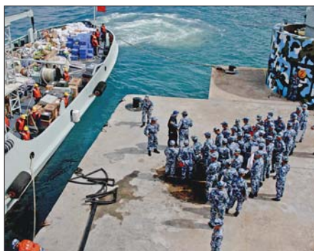
永暑礁上的官兵正在准备卸载由大陆运来的物资。

从住木板做底、油毡铺顶的第一代高脚屋,变着法儿地吃罐头,到住进钢筋混凝土筑成的第三代高脚屋,“无土运土无菜种菜无中生有”,一茬茬的守礁官兵,用20多年的汗水,把军犬待月都会“抑郁”的南沙,建设成了一座“海上花园”。守礁官兵用自己的忠诚守卫着祖国的南疆,用汗水见证着南沙的巨大变化。