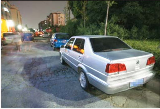
小区门口车主将车辆停放在门口和路边。