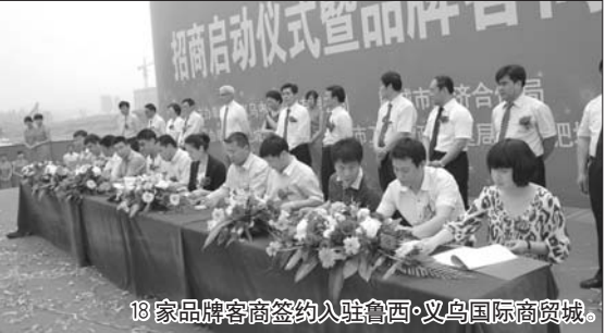
18家品牌客商签约入驻鲁西·义乌国际商贸城。

冷总:谢谢,在这里我也代表鲁西义乌国际商贸城的全体员工,祝愿大家身体健康,财源广进!