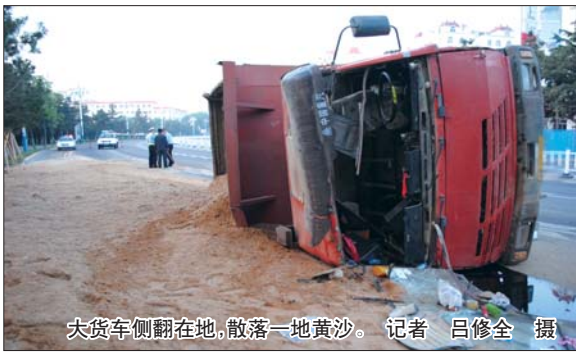
大货车侧翻在地,散落一地黄沙。

记者得到消息后赶到事发现场,交警一大队民警正在勘查事故现场,大货车所在的公司工作人员也赶到现场协助交警调查。红色斯太尔货车车头向北、右侧车体着地,前挡风玻璃破损,驾驶室内杂物散落在外。大货车拉载的建筑用黄沙倾泻一地,自南向北蔓延10余米,路边幸福公园的人行甬道上也被扣上了黄沙。据交警初步调查,司机周师傅驾驶大货车时间不长,并且这是第一次驾车驶入市区。事发路段是一弯路,交警估计大货车行经此地时车速过快,司机操作不当引发货车侧翻。 在四〇四医院,大货车司机周师傅接受了右手、右肘的