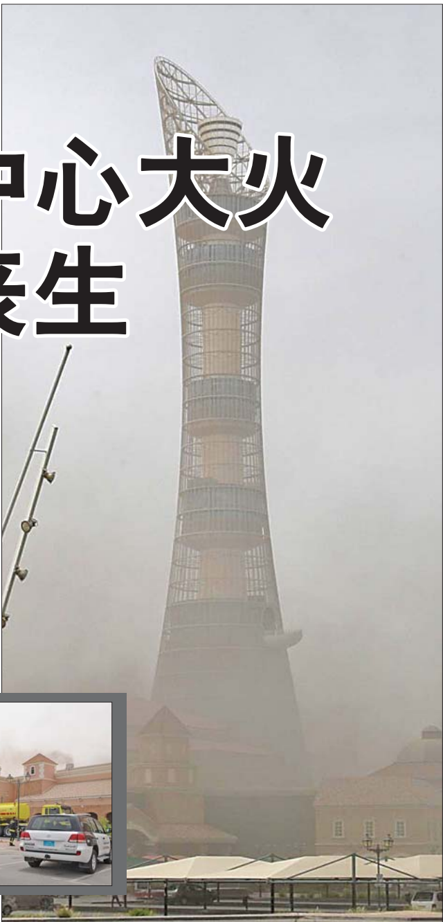
28日,浓烟笼罩了多哈著名的商业娱乐中心“维拉基奥”。