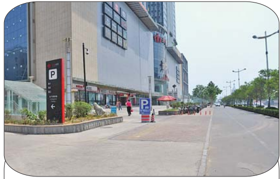
和谐广场周边没有乱停车现象。