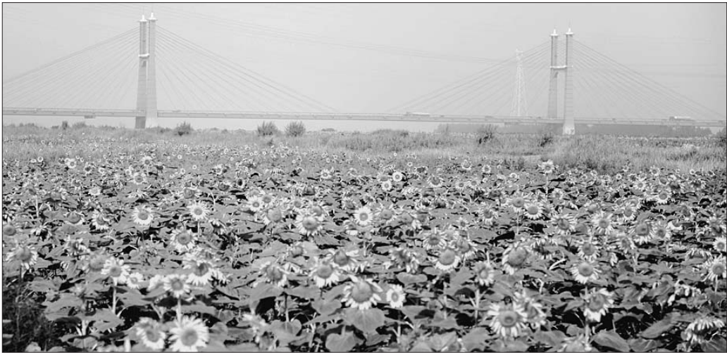
万亩葵园文化旅游节将于6月16日开幕。

本报5月29日讯(记者 王健) 29日,记者从垦利县旅游局了解到,黄河华滩万亩葵园将于6月9日盛世开园,并于6月16日举行好客山东—2012中国·垦利黄河华滩万亩葵园文化旅游节开幕式。