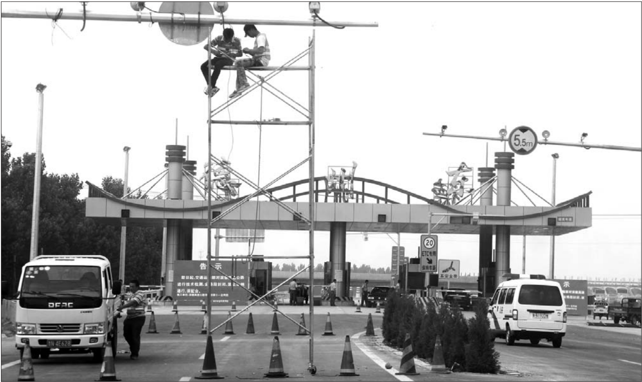
5月29日,滨德高速德州东收费站,工作人员正在对设备进行调试。

通车要求,德州段已经移交至德州市公路局,但滨德高速因故将推迟至6月上旬开通。 据了解,滨德高速在德州共有7个收费站,乐陵、庆云、宁津各有一个,德城区有四个,分别是德州东、德州西、德州北和德州与河北交界处的收费站。