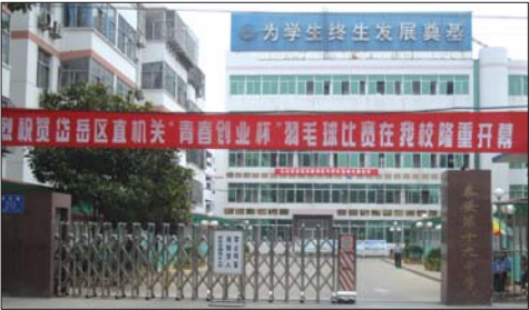
泰安十九中考点。

交通: 泰安十九中位于佛光路20号,沿着创业大街行走,到达佛光路向北行走300米即是。创业大街有小段路在维修,佛光路道路不平,坑坑洼洼不好走,开私家车送考家长需注意安全。建议学生乘坐学校包车去考点考试。直达十九中的公交车仅有K33路。7路车也会通往学校附近,但不直达学校,到达华新小区一站下车,还要行走近半小时才到,学生选择公交车时尽量选择K33路。 饮食: 泰安十九中附近没有大型饭店,位置较偏,校外烧烤店等不适合学生就餐,学校南100米路西有家赵家水饺、还有家众辉酒家,学生可选择在学校食堂就餐。 泰安十九中有两家食堂,位于学校北部和东南部,高考期间在食堂就餐每天40元包每日常三餐,学校补助10元,花40元能吃到50元的饭菜。所有进入食堂的菜品都需检查,学校设专门人员负责。保证所用食材卫生新鲜。