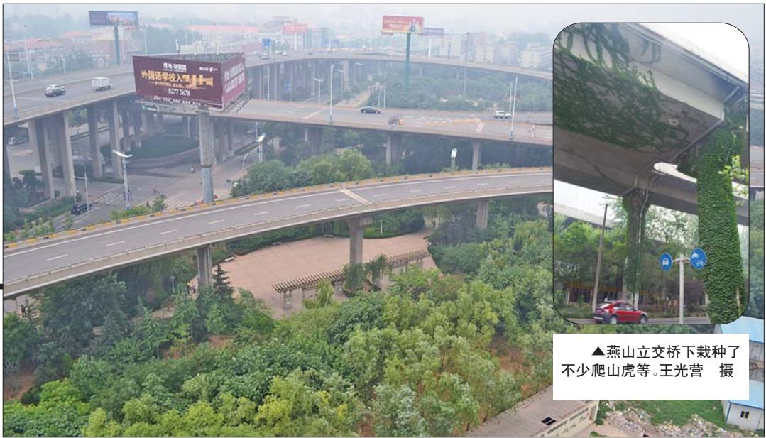
▲ 燕山立交桥下栽种了不少爬山虎等。