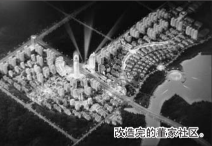
改造完的董家社区。