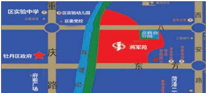
▲教育地产之将军苑