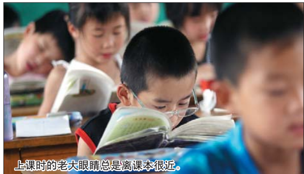
上课时的老大眼睛总是离课本很近。