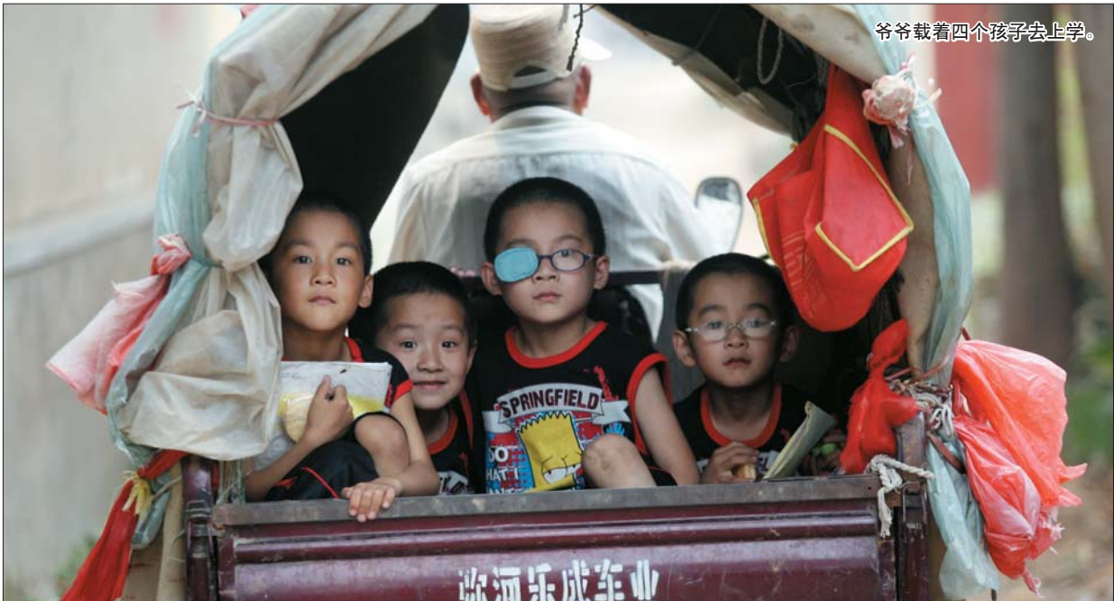
爷爷载着四个孩子去上学。