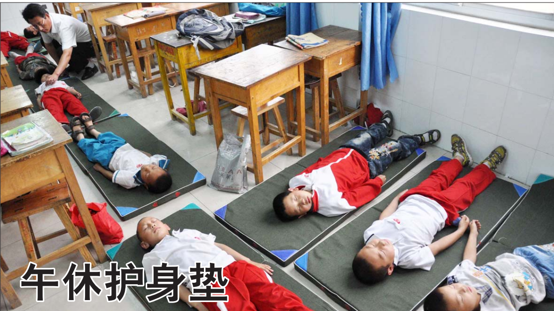
5月28日,秦皇台乡中心学校二年级的孩子们在新领的“午休护身垫”上休息。为解决留校儿童午休问题,滨州市滨城区秦皇台乡中心学校投资3万余元购买了450套体育用护身垫供孩子们午间休息使用,450名小学生从此告别回家带被子、中午趴桌子的午休做法。