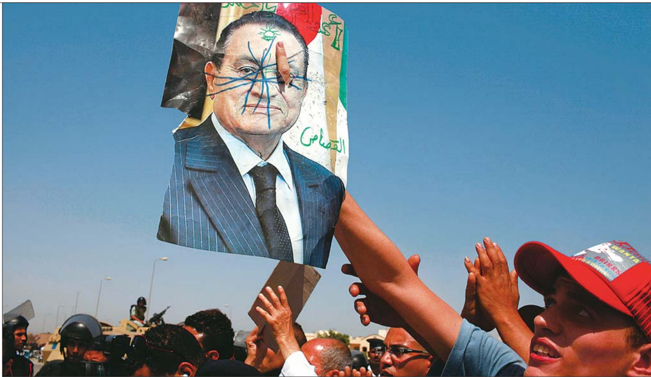
6月2日,在埃及开罗警察学院外,人们举着丑化穆巴拉克的画像庆祝其被判终身监禁。

终审预备:2月22日,法庭审理穆巴拉克所涉杀示威者案件。穆巴拉克当庭拒绝申诉,案件定于6月2日宣判。(宗禾)