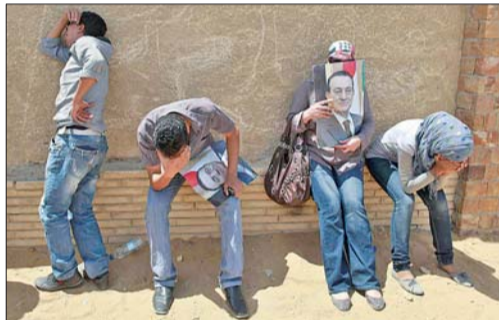
6月2日,在埃及开罗警察学院外,穆巴拉克的支持者听闻他被判终身监禁后十分沮丧。

据新华社开罗6月2日电 开罗刑事法庭主审法官里法特2日宣布,判处前总统穆巴拉克和前内政部长阿德利终身监禁,6名前高级警官被判无罪。