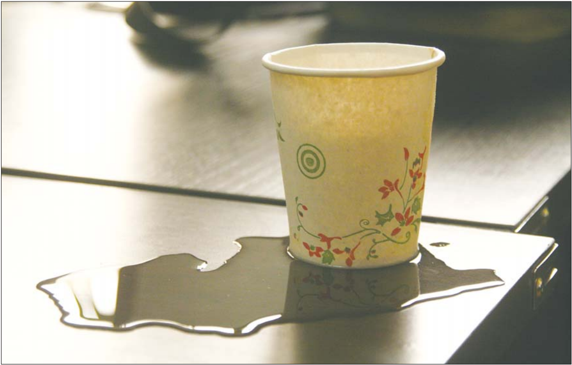
▲记者买来的纸杯,倒上热水半小时后,渗水严重。

纹,有的甚至通体被印刷。 记者在美食街和义乌小商品城发现,差不多大小的纸杯价格悬殊很大,50个为一包的纸杯,就有2.5元/包、4元/包和5元/包好几种。一纸杯销售商说,纸杯价格并不一样,主要的区别在于纸杯的材料,价格越高的,质量越好。 记者按照价格挑选了几种纸杯,倒上热水进行试验,半小时后,有的纸杯整个变软,渗水严重,有的闻起来存在异味。