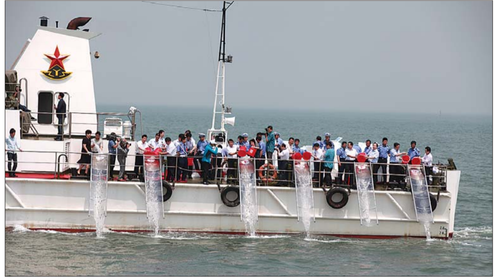
4日,船队在蓬莱海域实施增殖放流。

本报烟台6月4日讯(记者 刘红杰 李娜 实习生 胡永宁) 4日上午,“2012渤海生物资源修复放流活动暨山东海洋增殖放流周启动仪式”在蓬莱市举行,本次活动由农业部 and 山东省人民政府共同主办,投放1600万尾水生动物优质苗种,创我省海洋增殖放流规模之最。海洋渔业资源修复行动实施7年以来,全省回捕海产品26.7万吨,每年直接受益渔民近100万人。