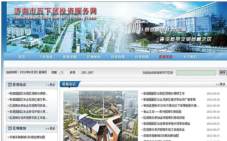
历下区投资服务网截图。张頔

对很多外地客商而言,浏览政府网站是了解一个城市招商引资情况最便捷的方式。本报曾在2月29日以《招商信息有的还停留在6年前》为题,报道了区县招商网站的建设情况。3个月后,不少区县网站的建设有了改观,但区县招商信息的整合却很难让人满意。由市发改委建设的济南招商网正在测试中,这个汇集全市招商引资信息的平台能否提供更多及时有效的信息?