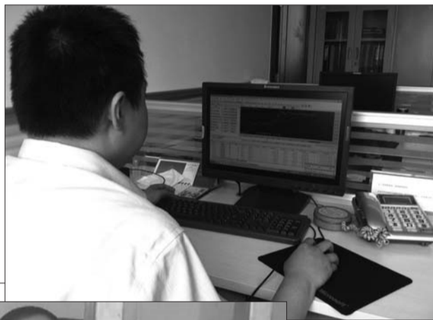
民警正在查看证据,录像上是受害人录制的交易过程。