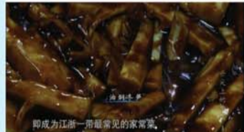
舌尖上的中国——油焖冬笋