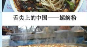
舌尖上的中国——锅贴