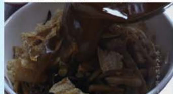
舌尖上的中国——广西柳州螺蛳