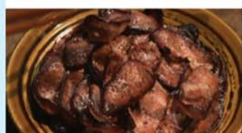
舌尖上的中国——云南诺邓血肠