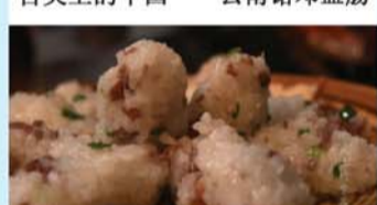
舌尖上的中国——火腿炒饭