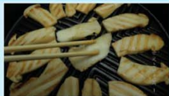
舌尖上的中国——碳烤松茸

@微天下: 【研究称上世纪格陵兰冰川融化速度超过现在】英国科技网站The Register报道,研究人员在分析探险家上世纪30年代的照片后声称,格陵兰岛冰川融化速度比现在要快。美国教授博克斯称,这可能是由于硫污染物有冷却效果。他还认为,在上世纪,西方60年代为防酸雨而减少硫污染物的努力导致70年代以来的气候变暖。