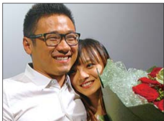
▲韩延求婚成功。

本报讯(记者 倪自放 实习生 李晓晓)青春纯爱影片《第一次》将于6月8日全国公映,5日剧组在济南百丽宫影城举行山东首映式,该片导演、从济南走出去的80后导演韩延携女友亮相首映式,并现场浪漫求婚。韩延表示,以后会拍关于济南的电影,“因为这里有我的青春印迹。”