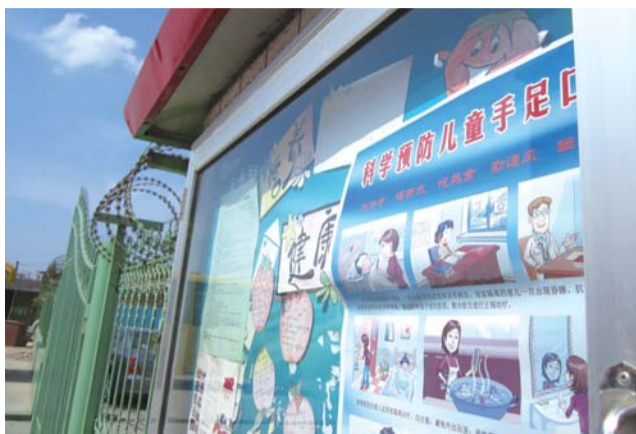
幼儿园门口贴着预防手足口病的宣传。