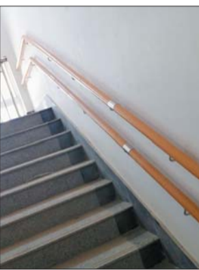
▲儿童福利院楼梯两侧都有扶手。