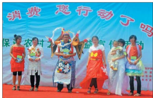
6月5日是第四十一个世界环境日,市环保局东昌府分局联合聊城大学生命科学院,在东昌府区道口铺举行了“环保进农村大型公益宣传活动”。

聊城市农委相关负责人介绍,今年大蒜的种植面积和去年相差不多,但由于天气原因,很多地方大蒜产量都下降,再加上本地蒜销往外地,造成本地大蒜供不应求,所以上市后不久,价格就开始上涨。从目前情况来看,还有可能继续上涨。“也许还会上演‘蒜你狠’”。