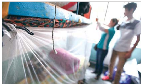
家长帮孩子挂上蚊帐。