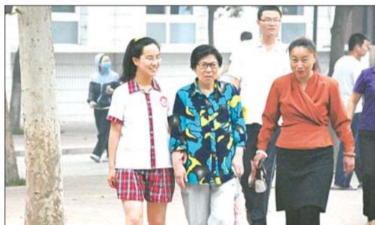
祖孙三代一起来看考场。

孙女说。“出门的时候一定把证件带齐,坐到座位上要放好东西,别弄丢了东西……”女生的妈妈一边向考场走去,一边嘱咐女儿。