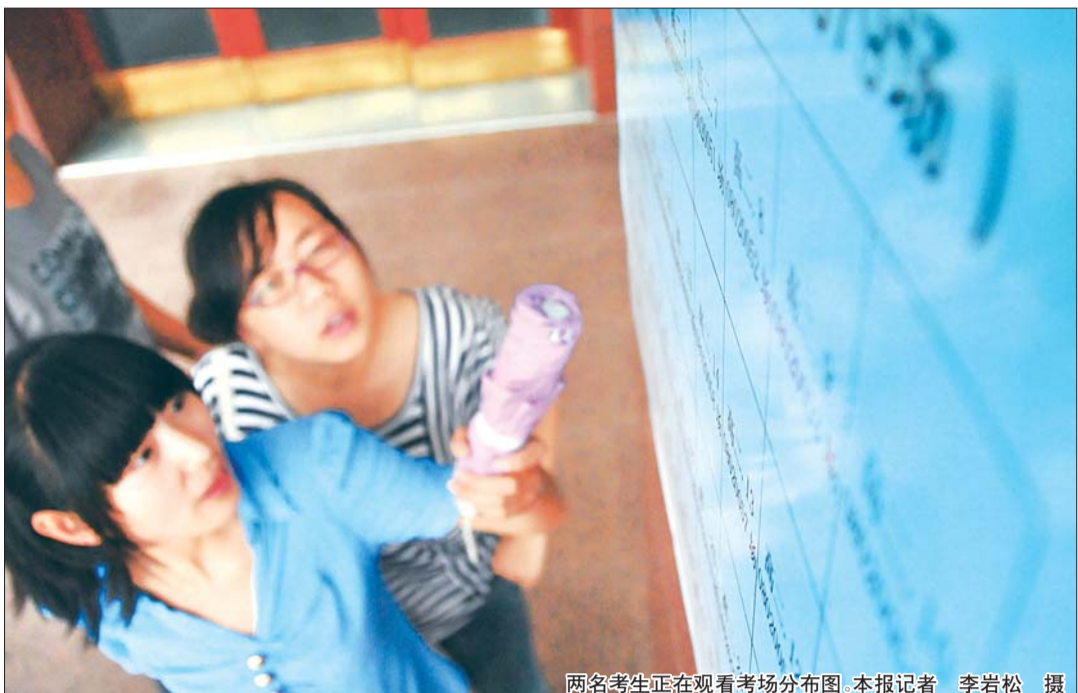
两名考生正在观看考场分布图。