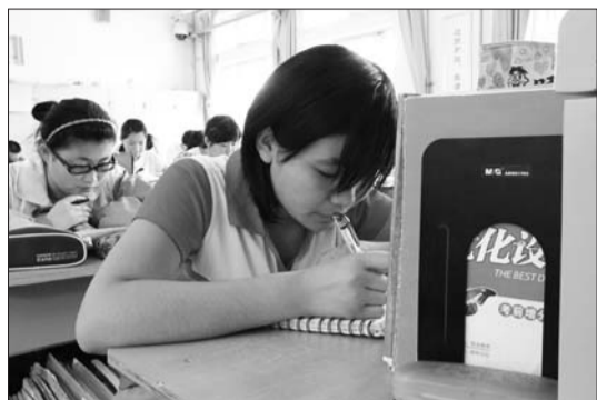
“最后一次在自己班里了,用最后的时间好好复习下。”