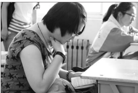
“明天我就坐在这里考试,现在先来感受一下。”