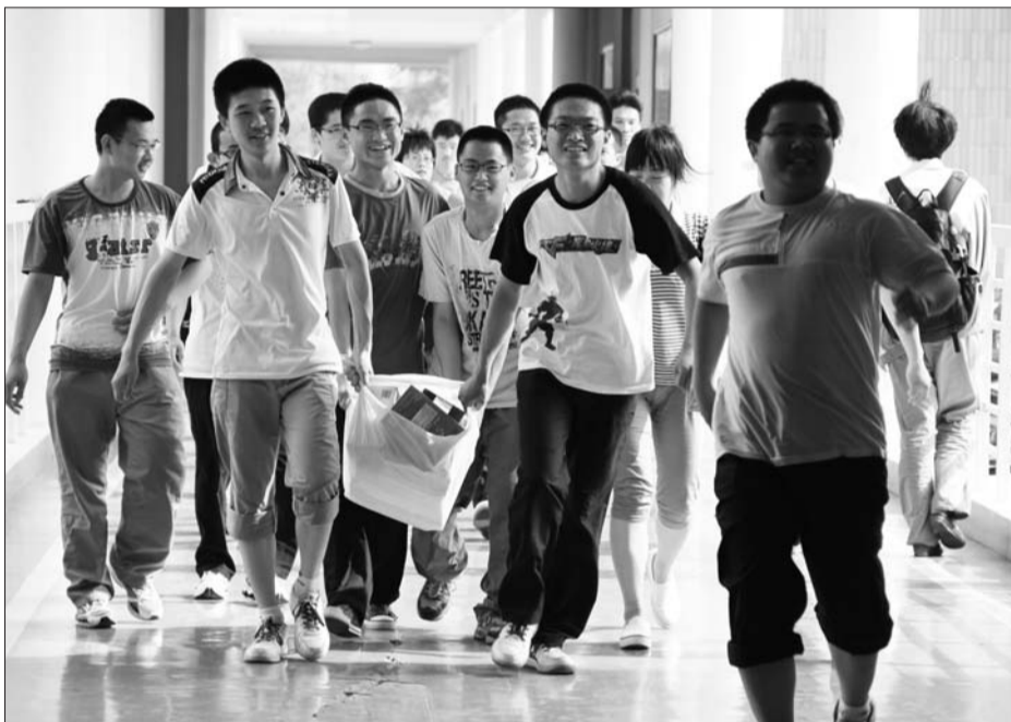
6月6日下午,在滨州市滨城区第一中学考点里,一群即将高考的高三学生抬着自己的书本运出考场外,以方便老师布置考场,也标志着他们的高中生涯即将结束。

“身份证、文具、水、毛巾、雨伞,还有记得8点10分就可以来这边领准考证。”一位高三的班主任正向自己的学生嘱咐考前需要带的东西。同时还将考试注意事项一遍又一遍地向看完考场的学生说着。这位班主任告诉记者,自己的学生都准备很充分了,现在他也不能要求什么了,能做的就是嘱咐他自己的学生别在考试的时候忘带了什么,要不然会很影响考试发挥的,“放平心态,不要紧张,把这当成一次普通的考试就没问题!”