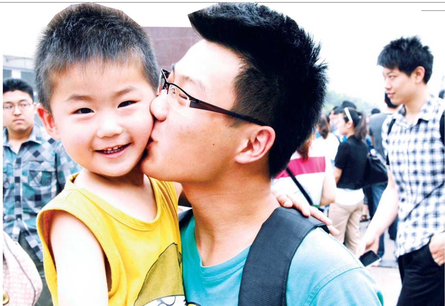
奖励“香吻”一枚。