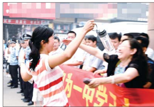
考试前,一名女生看见老师立刻上前拥抱。

显然,李老师这种加油方式非常受用,好多考生进考场前专门跑过来和李老师握握手,来一个拥抱,紧张的氛围立刻烟消云散。“我最多的时候带过二十多个班的历史课,几乎所有学生的名字我都能叫的上来!”李老师骄傲地对记者说。