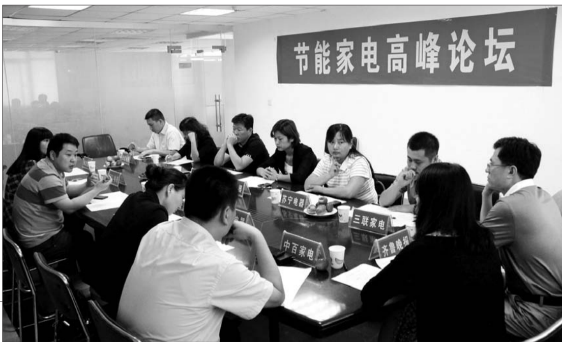
在本报会议室,潍坊各大家电卖场负责人及各大品牌家电厂商齐聚一堂。