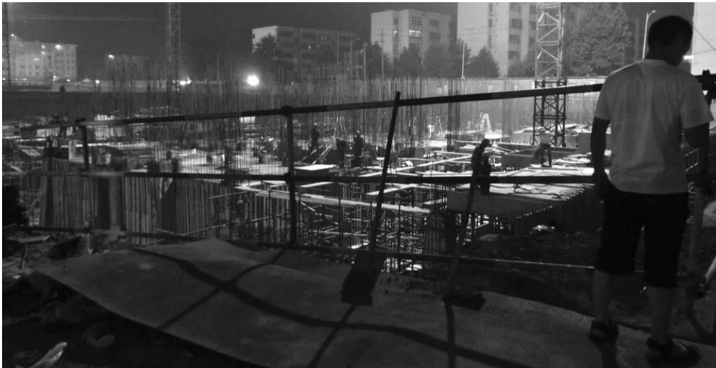
时间已过晚上10点,这个工地仍是灯光通明。执法人员责令其立即停止施工。

本报6月7日讯(记者 张浩)6日晚上,高考前一夜,记者跟随城市管理行政执法局奎文分局对奎文区各个建筑公司进行了巡查,健康街文化路附近一建筑工地由于10点以后仍在施工,执法人员对其出具了责令停止违法行为通知书,并将依法给予3万元的最高额度处罚。