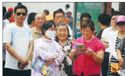
陪考大军。

本报6月7日讯(见习记者 张晓琳 孙婷婷 实习生 王乐伟) 7日,高考首日,记者从德城区三处考点了解到,因孩子不让陪考,不少家长都是偷偷等在考场外面。