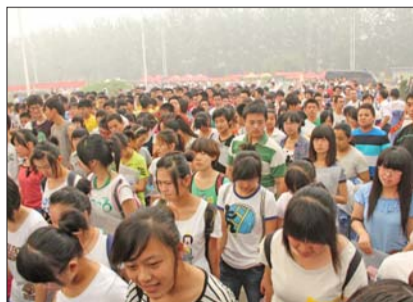
7日上午,北镇中学考点外等候入场的考生。