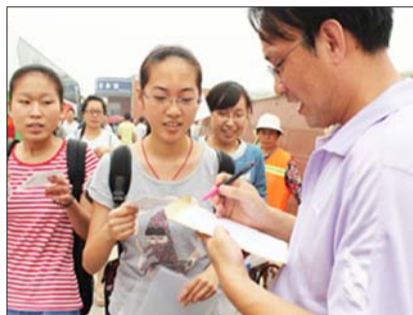
带队的老师发放准考证。