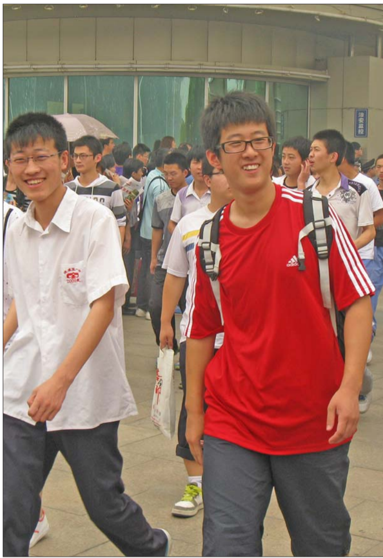
7日上午考完语文第一场,考生陆续走出校门。

为确保今年高考安全有序进行,滨州市公安局提前一周启动高考安保工作方案,协同教育考试部门深入落实各项安全工作,治安、消防等部门深入各考点及试卷保密室等涉考场所,认真开展安全大检查,配合教育考试部门及考点责任单位做好内部安全防范工作,及时消除各类安全隐患。