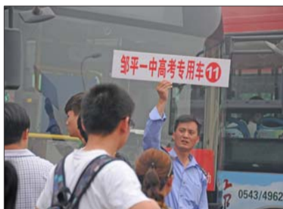
一名高考专用车司机把车牌举得很高,以便考生更快地找到车。