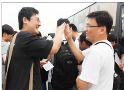
考试前,两位考生互相加油。