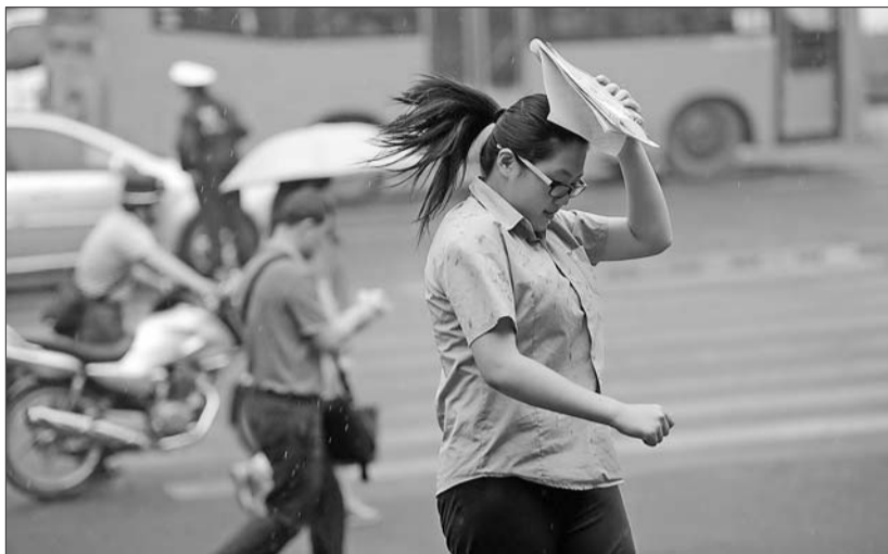
8日一早,一场雷雨降临济南。在山东省实验中学门口,一名忘带雨具的考生一路小跑进入考场。