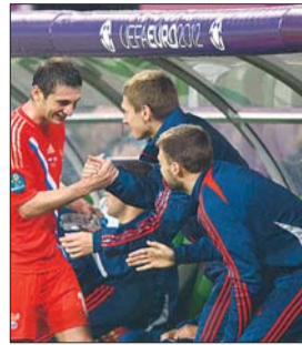
扎戈耶夫一鸣惊人。