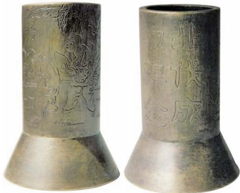
民国北伐成功纪念刻铜笔筒