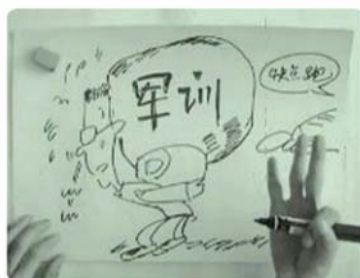
▲视频手绘画“大学四年”(图片来自视频截图) ◀再见了，大学(图片来自视频截图) ▶视频手绘画作者许超。