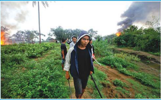
6月10日,在缅甸若开邦首府实兑,一名若开族男子携自制武器走过燃烧的房屋。