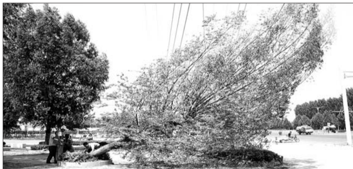
▲园林工作人员无奈地将自己亲手栽种的柳树伐断。 ▶被伐的柳树从里往外腐烂,树皮也一碰就掉。