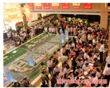
临沂皮革城人气爆棚