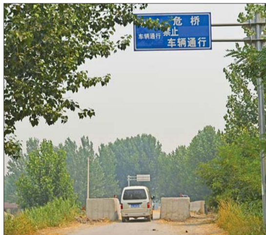
为了禁止大货车通行,坝子大桥加装了隔离墩。

据了解,坝子大桥目前除只供普通车辆通行外,大型载重车都绕行机场路、洪家园等几座新修的大桥。