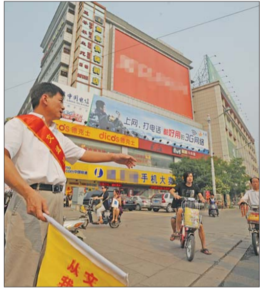
司机“协管”劝阻行人遵守交通规则。

本报6月13日讯(见习记者 张泰来) 13日下午,趵突泉北路与泉城路交叉口,更不用提了。”现场,王先生一边指挥着行人,一边感慨。